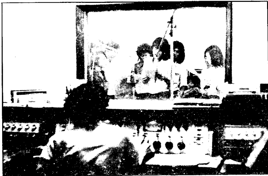
การแสดงในห้องส่ง