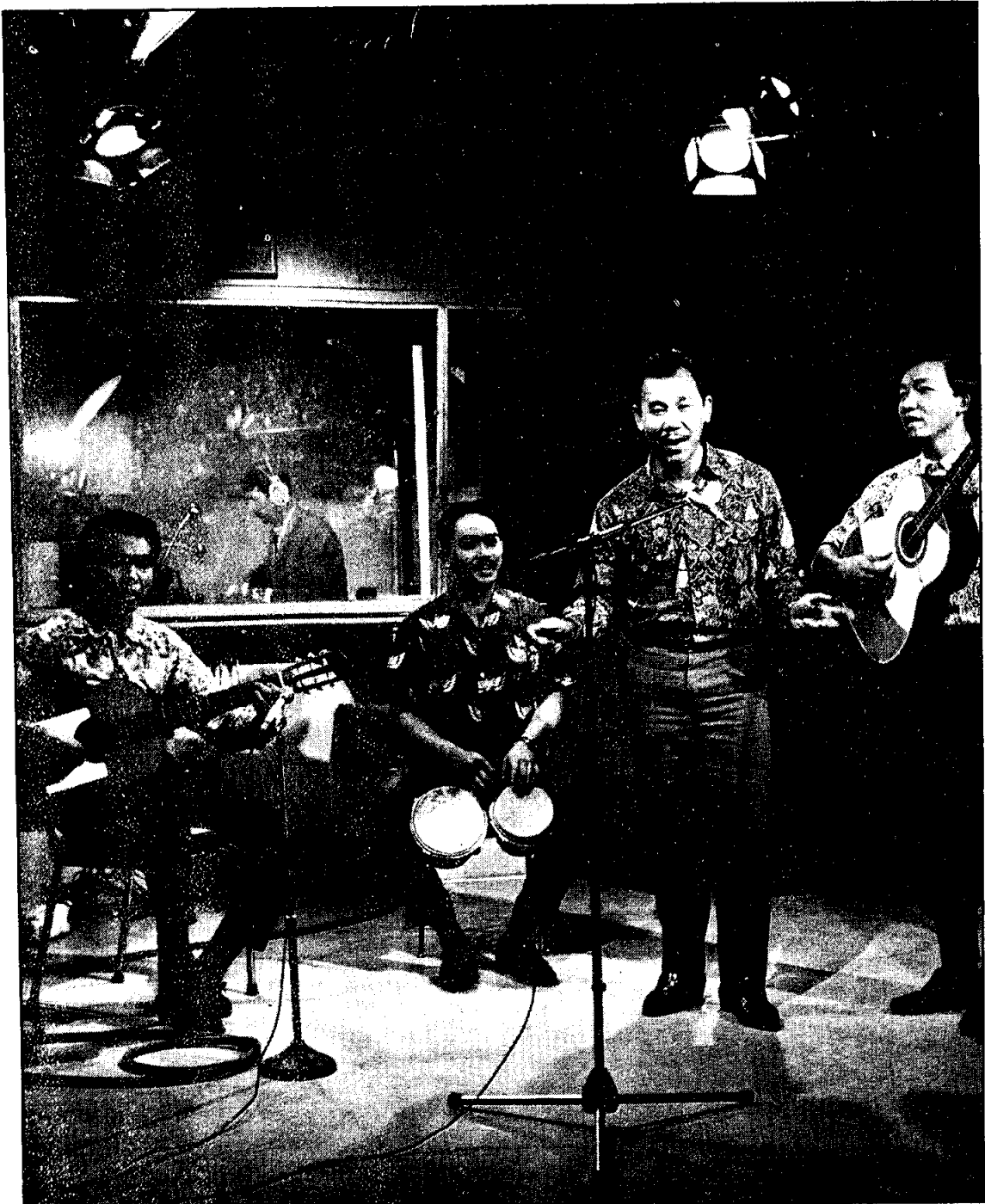
การแสดงรายการสดทางวิทยุ