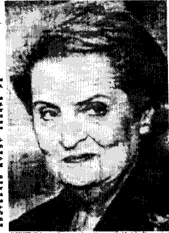
ALBRIGHT: Highest posting.

First female to get top US Cabinet posting